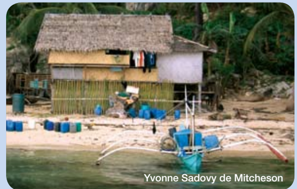
Yvonne Sadovy de Mitcheson

Pour la construction d'un programme de gestion intégrée, il faut aussi inclure la valeur ajoutée certaine apportée par une réserve.