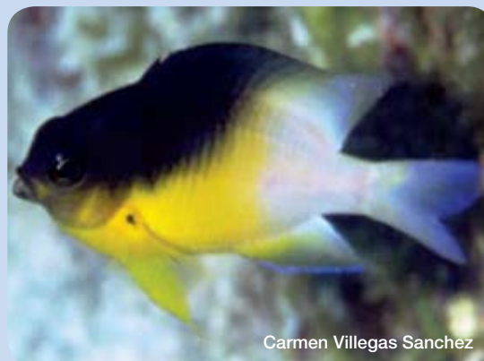
Carmen Villegas Sanchez

La connaissance détaillée de la dispersion des larves dans l'espace, appelée également 'l'enveloppe de dispersion', pourrait aider à déterminer si: (i) la taille d'une réserve garantirait l'auto-recrutement, (ii) l'emplacement et l'espacement des réserves favoriseraient le maintien des populations ciblées par la dispersion entre elles, et (iii) la taille, l'espacement et le placement d'un réseau de réserves seraient de maximiser les avantages potentiels de la pêche sur les zones de pêche voisines par une augmentation du recrutement. Notre connaissance des 'enveloppes de dispersion' est limitée pour deux raisons ; premièrement, car les modes de dispersion des larves sont spécifiques en fonction des espèces, du site et du temps. Deuxièmement, car ces modes sont déterminés par un processus complexe au niveau comportement, physique et hydrodynamique.